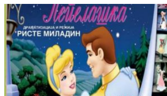
Премиера на претставата „Пепелашка“ во Струга