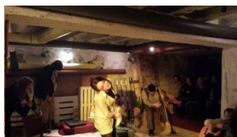
Претставата „На дното“ вечерва на репертоар на Народниот театар Охрид