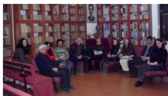
Литературниот клуб „Григор Прличев“ го одбележа Светскиот ден на поезијата