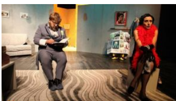
Охридскиот Народен театар ќе го одбележи Светскиот ден на театарот