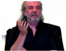
Болниот на Балканот