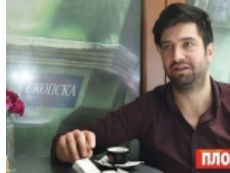
За лагите на режимската слуга Пандов