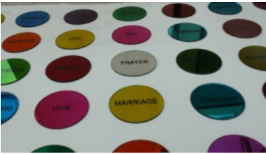
Обоена истрајност: дело на Марија Сотировска.