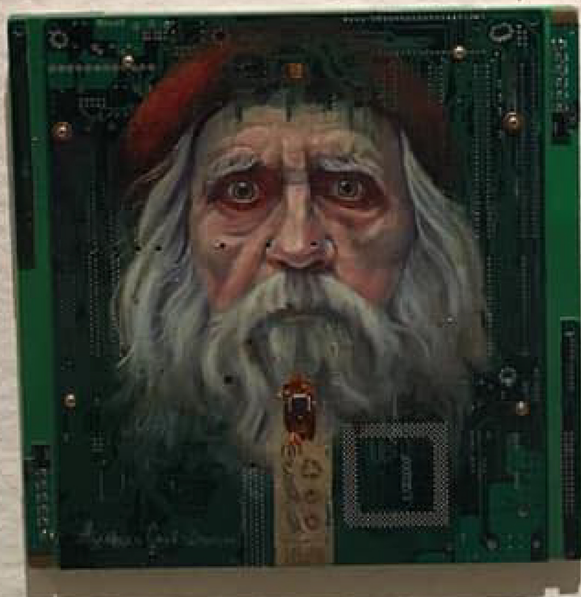
Alina Popescu, "Măscă de noapte" Măscă de noapte, 2015, ulei pe pânză Colecția "Măscă de noapte" din cadrul Galeriei "Galeria de Artă Contemporană"