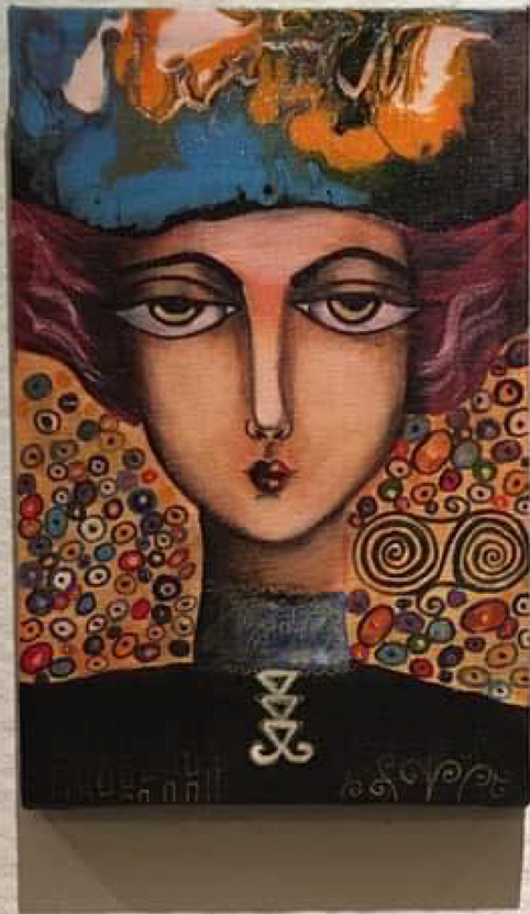
Alina Popescu, "Măscă de noapte" Măscă de noapte, 2015, ulei pe pânză Colecția "Măscă de noapte" din cadrul Galeriei "Galeria de Artă Contemporană" Măscă de noapte de pânză